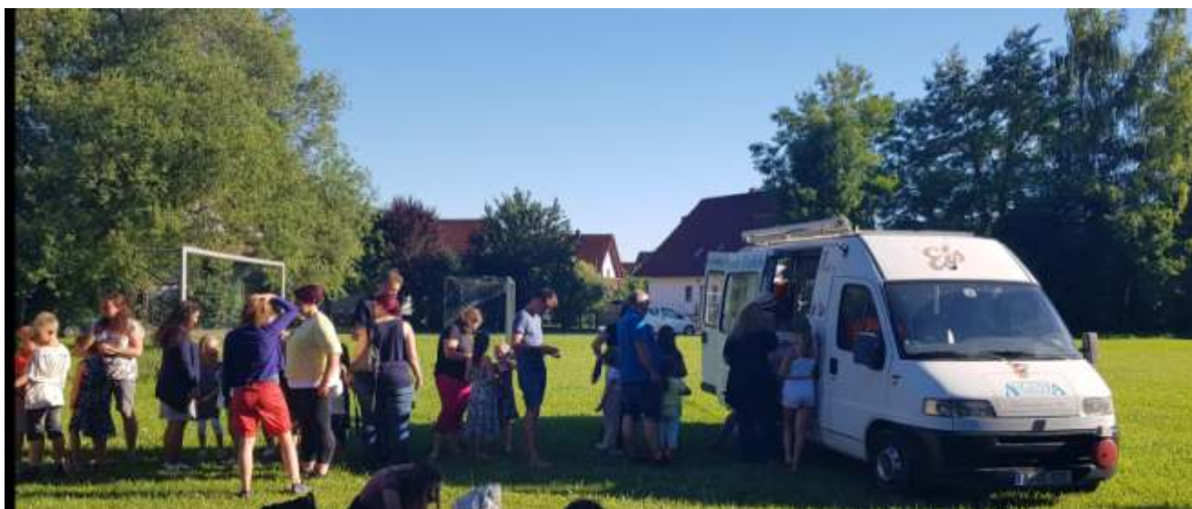
Kinder, Erwachsene und auch der Eisverkäufer freuten sich über die kühle Erfrischung und die erzielte Einnahme

Ein rundum gelungenes Fest, vielen Dank an alle Organisatoren und helfenden Hände.