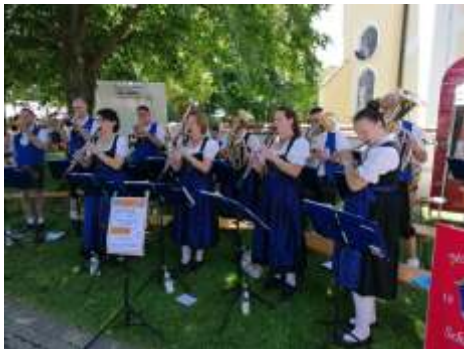
Beim Kapplfest spielten wir mit zünftiger Blasmusik auf.

In den Sommerferien beteiligte sich der Musikverein am Ferienprogramm der Gemeinde. Es wurde Schnupperunterricht am Schlagzeug, am Tenorhorn, an der Trompete sowie an der Querflöte angeboten, der sehr gut angenommen wurde. Außerdem fand die „Sommermusik“ für Kinder ab drei Jahren statt. An dem für alle spaßigen Nachmittag tanzten, musizierten und sangen die Kinder und sie durften kleine Bienen und Hummeln basteln, die dann zu dem bekannten Stück „Hummelflug“ durch die Schmiechachhalle sausten.