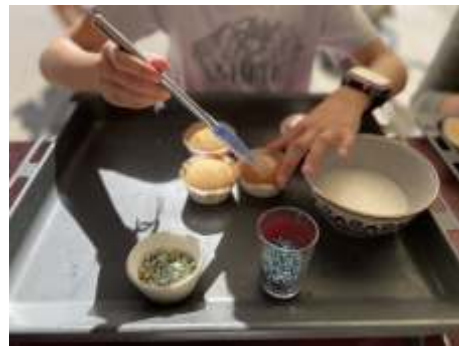
Kinder backen Muffins für bedürftige Menschen aus der Region