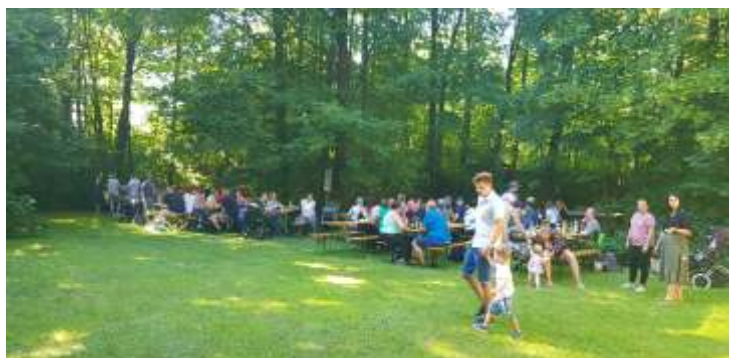
Zahlreiche Teilnehmer am Sommerfest