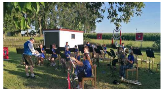
Bei der Sommerserenade waren auch unsere Jungmusiker*innen mit von der Partie.