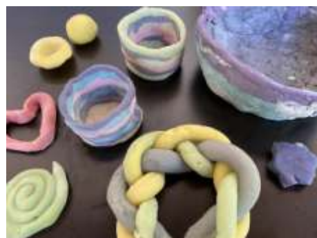
Spaß am Kneten