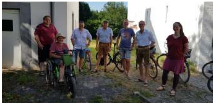
Besichtigung des ehemaligen Jugendheimes an der Ringstraße 42