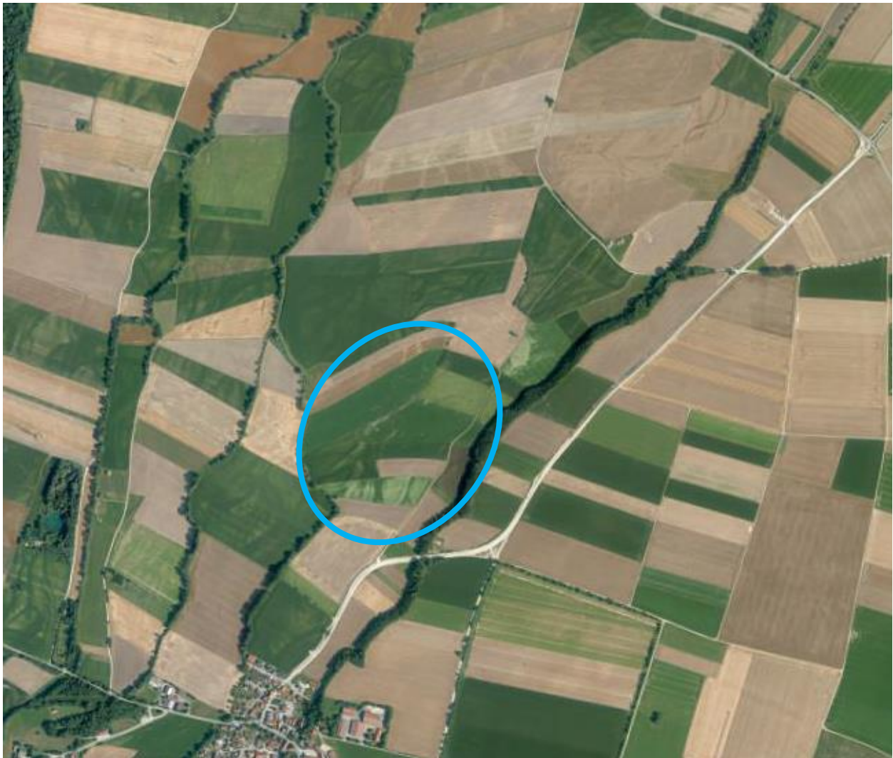
Abbildung 3: Luftbild vom Plangebiet, o. M.