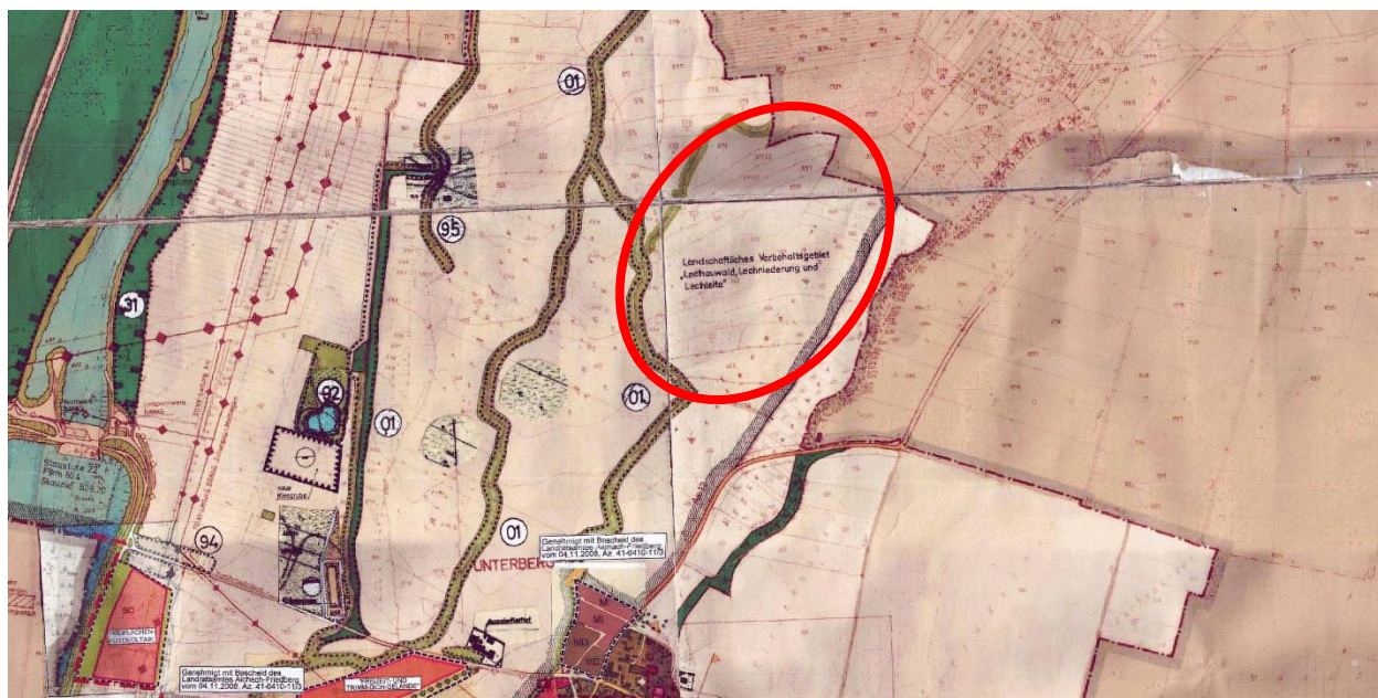
Abbildung 1: Wirksamer Flächennutzungsplan in der Fassung vom 12.04.1989, o. M.

Der Flächennutzungsplan wird im Parallelverfahren geändert.