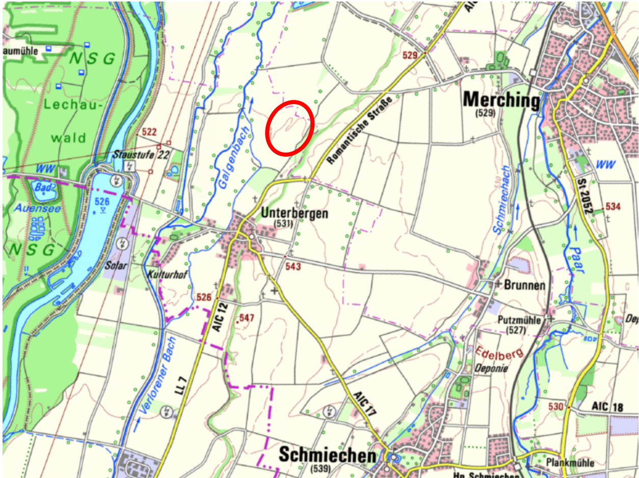
Abbildung 2: Topographische Karte vom Plangebiet und der Umgebung, o. M.

Das Planungsgebiet schließt sowohl im Norden (Fl. Nrn. 571, 569, 568 und 567) als auch im Süden (Fl. Nr. 492) an landwirtschaftlich genutzte Flächen an. Im Osten verläuft der Feldweg mit der Fl. Nr. 487/2, während im Westen ein Seitenarm des Verlorenen Baches (Fl. Nr. 107/2) entlang fließt.